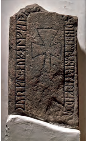
Bodilskerrunesten. Foto Roberto Fortuna.

På Nationalmuseets hjemmeside kan du også se, hvad runerne betyder.