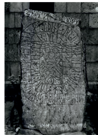
Skjern-runesten. Foto Erik Moltke.

Billederne er alle fra Nationalmuseets Online samlinger http://samlinger.natmus.dk/ . CC-BY-SA