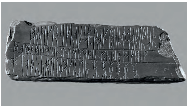
Skifersten med runer fra Kingittorsuaq, Upernavik.