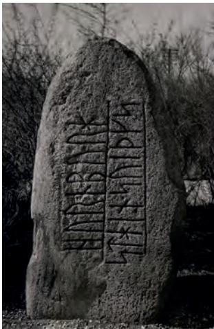
Høje Tåstrup-runesten.